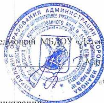
График работы членов администрации